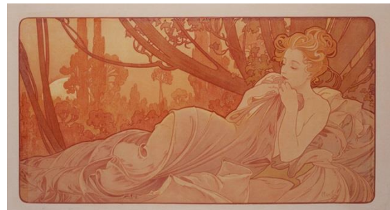
公開中《黄昏》1899年 OGATA コレクション

公益財団法人佐川美術館（所在地：滋賀県守山市）では、2017年夏季企画展「アルフォンス・ミュシャ展 麗しきアール・ヌーヴォー」を開催中です。展覧会の主要を占めるOGATAコレクションに新たに加わったミュシャ直筆の《黄昏（習作）》をどこよりもいち早く公開させていただく事になりましたので、お知らせいたします。今回追加公開する《黄昏（習作）》は、本制作と比べると背景の構図はほとんど同一ですが、女性の表情や手の位置、身に纏っているシーツの有無など、麗しい作品に仕上げるミュシャの巧みな表現方法や、より女性を美しく描こうとする制作過程を見ることができます。完成されたリトグラフ作品と異なり世界に1点しかなく、ミュシャのリアルなタッチをご覧いただける希少な作品です。《黄昏》と《黄昏（習作）》の並列展示は、8月23日（水）から会期終了日9月24日（日）までご鑑賞いただけます。