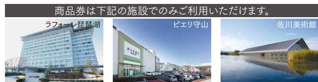
ビワイチ守山へGO!キャンペーンTICKET (参加券) 1,000円