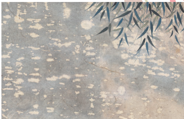
⑤ 源氏物語 第五十一帖 浮舟 2008年 紙本彩色 H30.9×W47.2cm