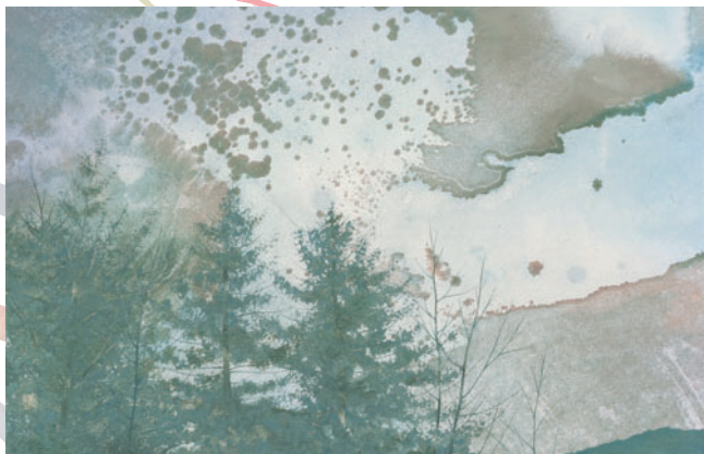
① 源氏物語 第一帖 桐壺 2008年 紙本彩色 H30.9×W47.2cm