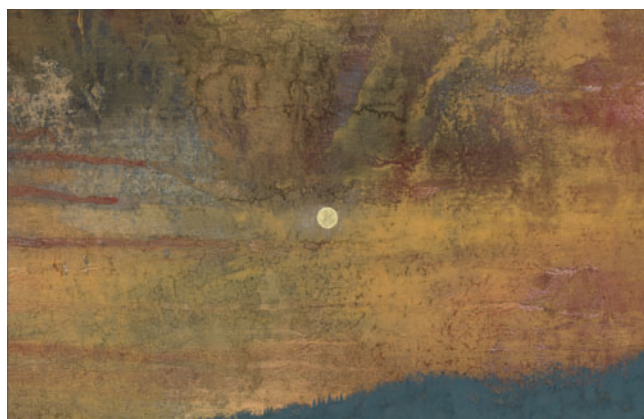
④ 源氏物語 第三十四帖 若菜(上) 2011年 紙本彩色 H30.9×W47.2cm