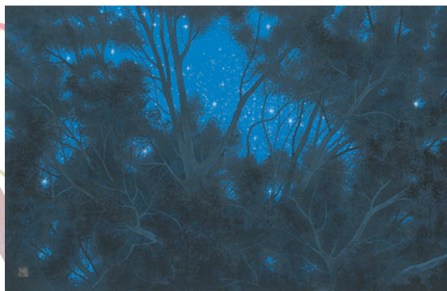
⑥ 源氏物語 光源氏 2009年 紙本彩色 H30.9×W47.2cm