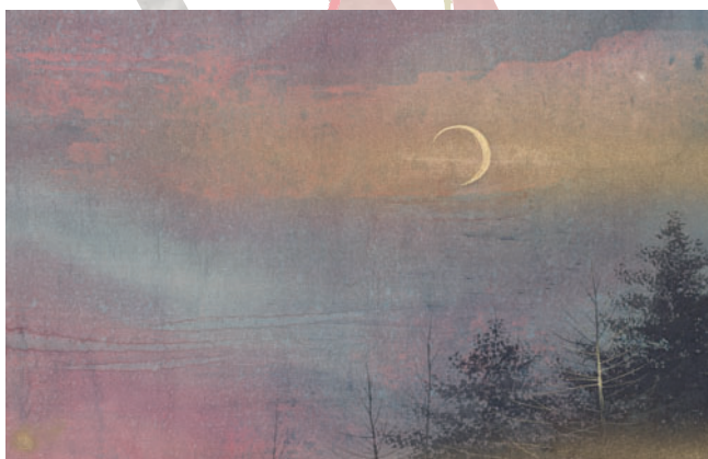
③ 源氏物語 第二十四帖 胡蝶 2011年 紙本彩色 H30.9×W47.2cm