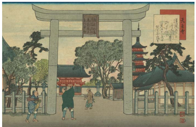
④ 『東海道名所膝栗毛画帖』天王寺 大正時代 大判錦絵 94.0×40.0cm 芸艸堂蔵