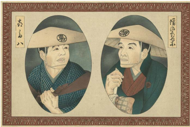
① 『東海道名所膝栗毛画帖』 表紙（弥次郎兵衛、喜多八） 大正時代 大判錦絵 94.0×40.0cm 芸艸堂蔵