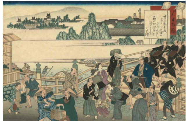
② 『東海道名所膝栗毛画帖』日本橋 大正時代 大判錦絵 94.0×40.0cm 芸艸堂蔵