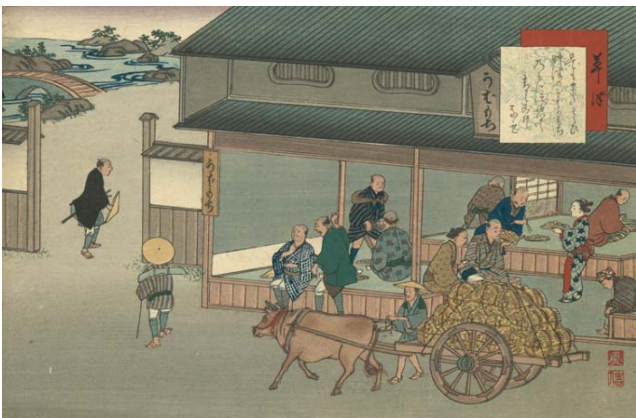
③ 『東海道名所膝栗毛画帖』草津 大正時代 大判錦絵 94.0×40.0cm 芸艸堂蔵