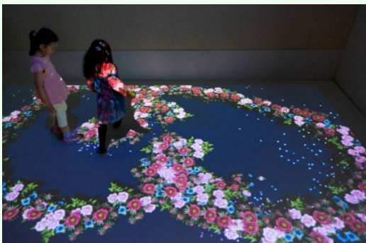
協力：名古屋造形大学 情報表現領域