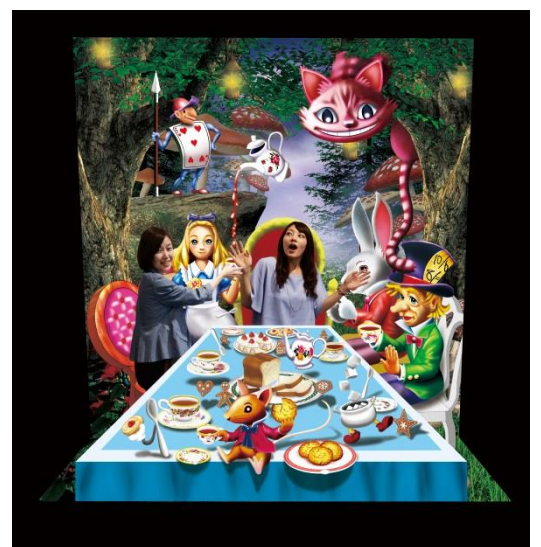
4. 《3D アートゾーン》 ©Handspro

不思議の国に迷い込んだアリスのように、身体が大きくなったり小さくなったりします！人間の目の錯覚を利用した不思議体験ができる 3D アートの世界に入り込みます。3D アートはトリックアートとも呼ばれ、元々ヨーロッパでだまし絵として誕生しました。この 3D アートゾーンでは写真撮影ができます。最高の 1 枚を SNS にアップして、家族や友人と不思議体験の思い出づくりをしましょう！