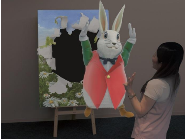
1. 《プロジェクションマッピングゾーン》