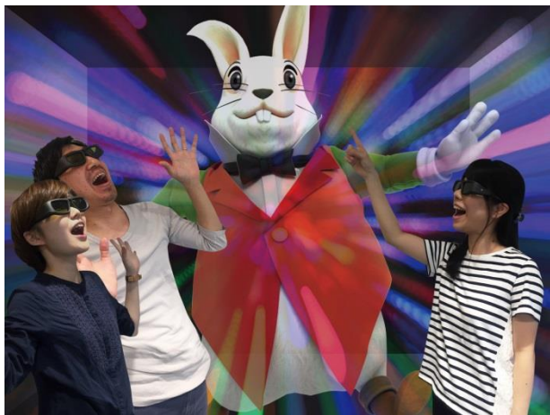
3. 《3D 映像ゾーン》