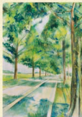
【第13回】小学校高学年の部 大賞作品