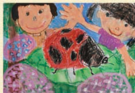
【第13回】未就学児の部 大賞作品

主催：公益財団法人SGH文化スポーツ振興財団 後援：文化庁、滋賀県、滋賀県教育委員会